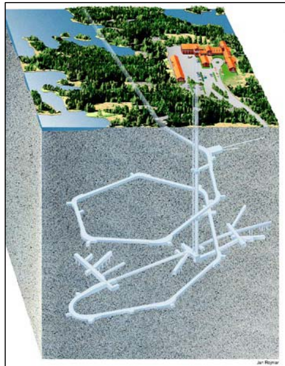
Le laboratoire d'Aspo.

Ce laboratoire dispose d'une descenderie que nous avons empruntée en bus, sa pente est de 14% sur 3 km de long. La descenderie tourne autour de l'axe de l'ascenseur central. Le creusement s'est fait sur 5 ans et a permis des études sur la déformation de la roche, la vérification des couches ou les déformations. Les mêmes méthodes ont été appliquées sur les 2 sites pressentis pour le futur centre de stockage. Il y a eu aussi 40 forages de surface, jusqu'à 1 000 m, avant le creusement du laboratoire. Les mêmes résultats ont été obtenus en début et en fin de creusement. Depuis 1995, 3,6 km de galeries ont été creusées, elles font 5 à 7 m de diamètre. Ce laboratoire est un démonstrateur du concept de stockage, avec des puits verticaux, et aussi des essais d'alvéoles horizontales. Il y a des stations de pompage de 1 200 L/min installées régulièrement.