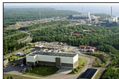
Le CLAB.

Le CLAB est un entreposage des CU à vocation intermédiaire. L'installation comprend un port par lequel arrivent les colis toutes les semaines. L'entreposage lui-même est situé à -40 m. Il est basé sur un stockage en piscine, comme à La Hague. L'entreposage a été construit entre 1980 et 1985 et il a 30-40 ans de colis stockés.